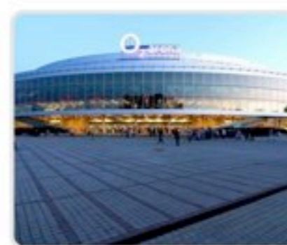
O2 Arena, Tsjechië