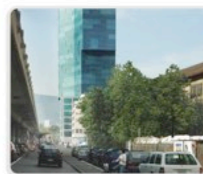
Prime Tower, Zwitserland